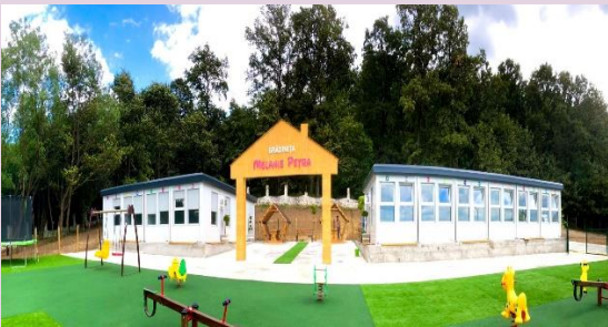
Foto – model grădiniță